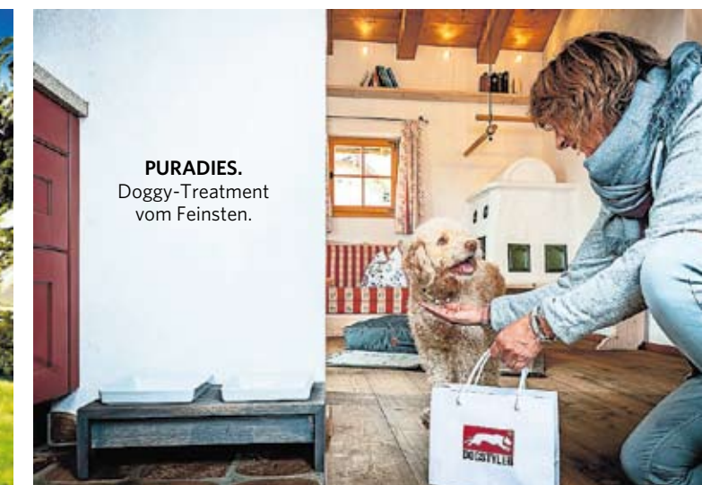
PURADIES. Doggy-Treatment vom Feinsten.