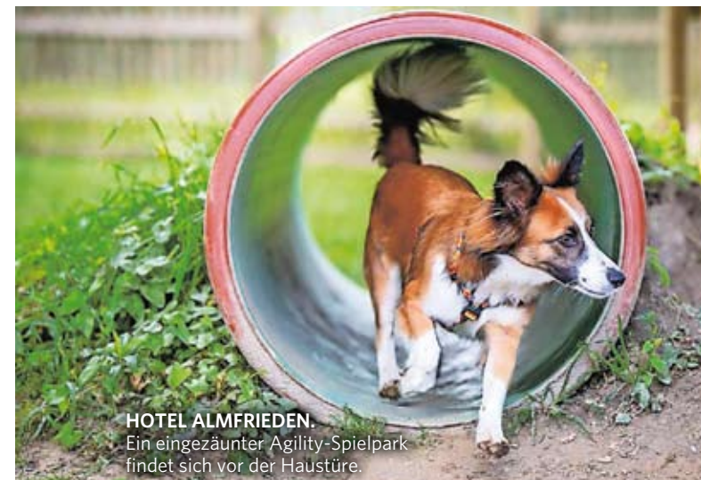
HOTEL ALMFRIEDEN. Ein eingezäunter Agility-Spielplatz findet sich vor der Haustüre.

Hotel Almfrieden/Ramsau. Im Hotel Almfrieden sind Hunde nicht nur erlaubt, sondern auch gern gesehene Gäste. Bereitgestellt →