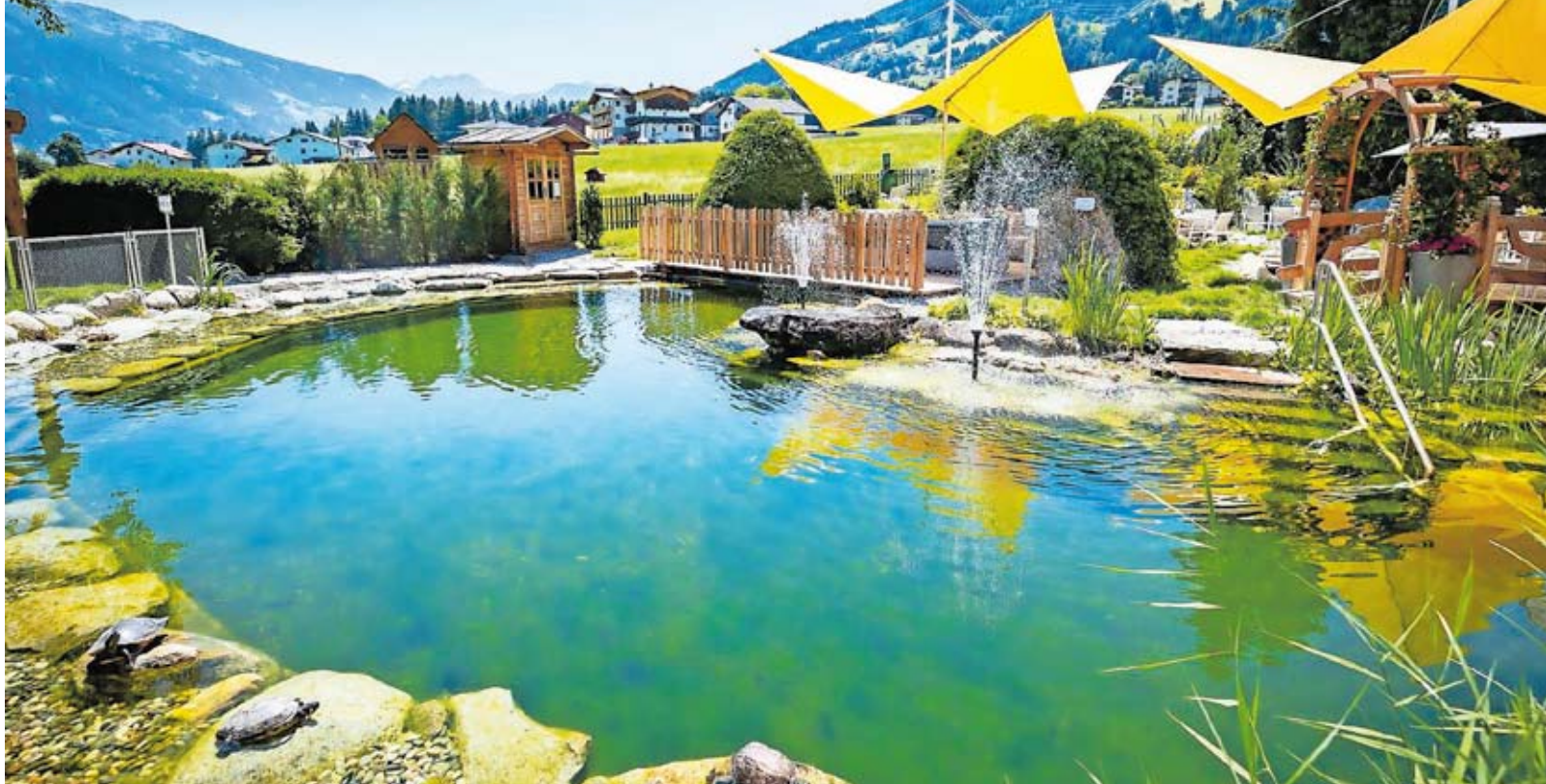
WASSERSPASS für den besten Freund ist im Hotel Magdalena im schönen Zillertal garantiert.

Hotel Magdalena/Zillertal. Das Hotel Magdalena in Ried im Zillertal ist weit über die Grenzen Tirols hinweg als eines der besten Hundehotels in Europa bekannt. In den 1970er-