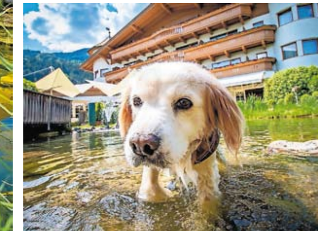
HOTEL MAGDALENA. Erste Adresse für alle, die nicht auf ihren Vierbeiner verzichten möchten.

Jahren eröffnet, entwickelte Familie Riedl das Magdalena durch diverse Renovierungen und Umbauten über die Jahre zu einer wahren Institution für Hundeliebhaber aus aller Herren Länder. Nicht ohne Grund, denn mit eigenem Speisebereich im Restaurant, Hunde-Schwimmteich, eingezäuntem Hundeerlebnisspielplatz, Yoga mit Hund, speziellen Hundemassagen u. v. m. bietet das 4-Sterne-Hotel dem geliebten Vierbeiner ein Angebotsspektrum, das seinesgleichen sucht. Ein weiterer Aspekt, der von Hundehaltern mit Begeisterung aufgenommen wird: Im Hotel Magdalena nächtigt der beste Freund des Menschen kostenlos.